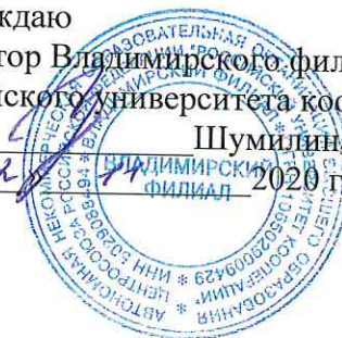
ГРАФИК ЛИКВИДАЦИИ АКАДЕМИЧЕСКОЙ ЗАДОЛЖЕННОСТИ за 2020-2021 учебный год